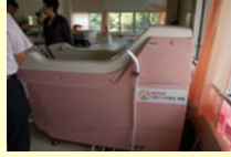
車いすごとに入れる特殊浴槽を購入