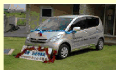
贈呈車(ダイハツ・ムーブ)