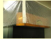
熱気の広がりを防ぐためダクトの周りにビニールを取り付け