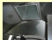
熱気を外に排出するダクト

厨房は空調設備が整っていないため、夏は猛暑の暑さの一日中パンを焼いていましたが、ダクトを取り付け、蒸気の熱気を外に出すことが出来るようになりました！